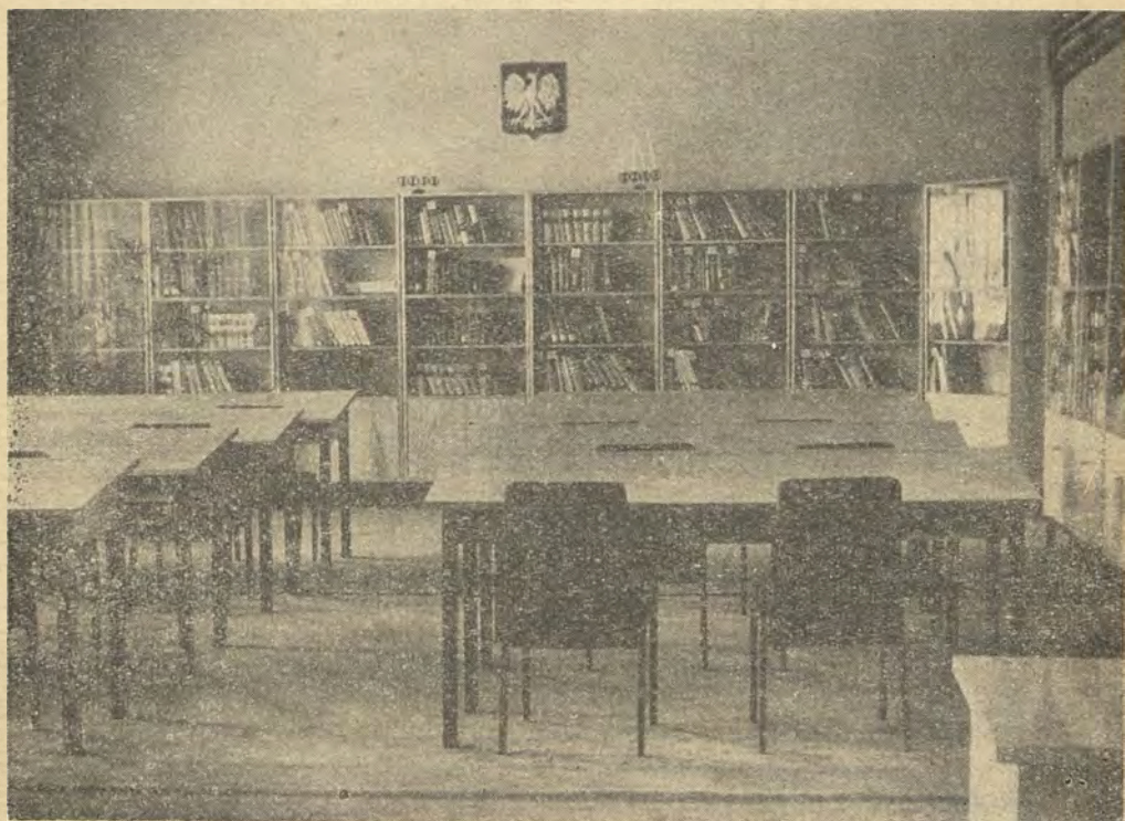
PiMBP w Koźlu — sala wykładowa, w której odbywają się zajęcia przysposobienia bibliotecznego

Sprawa jest warta przedyskutowania, gdyż Kuratorium Opolskie bardzo interesuje się przysposobieniem bibliotecznym i w nowym roku szkolnym chciałoby zwiększyć ilość szkół podejmujących tę formę przygotowania do zawodu bibliotekarza. Sądzę, że i w innych miastach będzie podobnie. Rezerwy w zawodzie biblioteczkim dla personelu ze średnim wykształceniem fachowym są przecież duże i stwarza to szansę