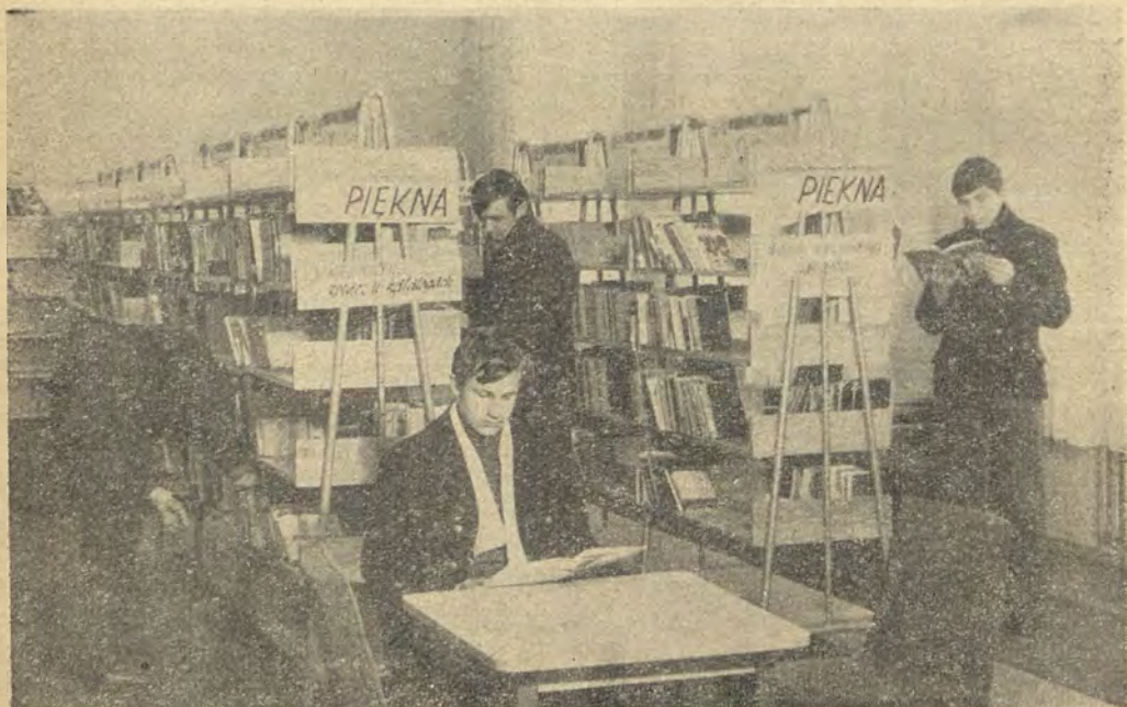
PiMBP w Koźlu — wypożyczalnia

Program opracowany przez Ministerstwo przewiduje 130 godzin wykładów połączonych z ćwiczeniami i 30 godzin praktyki. Program zresztą jest ramowy i można go w miarę potrzeby uzupełniać lub korygować. Przewiduje on dość dużo miejsca na technikę biblioteczną, organizację pracy biblioteki, zapoznaje z siecią bibliotek w Polsce, udostępnianiem księgozbioru i pracą z grupami czytelników oraz czytelnikami indywidualnymi, wprowadza w zagadnienia służby informacyjno-bibliograficznej. Zajęcia prowadzone w oparciu o dobry warsztat, inaczej mówiąc w konkretnej bibliotece, w zasadzie powinny przygotować ucznia do pracy w bibliotece gromadzkiej, a w bibliotece wyższego stopnia organizacyjnego dają pracownika zorientowanego w zawodzie, który po pogłębieniu wiedzy może pracować w każdym dziale. W pewnym stopniu specjalizacja ta przygotowuje przyszłych kandydatów do studiów bibliotekarskich stacjonarnych i zaocznych, gdyż kandydat jest wprowadzony w zagadnienia zarządu i nie podejmuje decyzji na ślepo, wiedząc co go czeka i czego może się spodziewać po studiach bibliotekarskich.