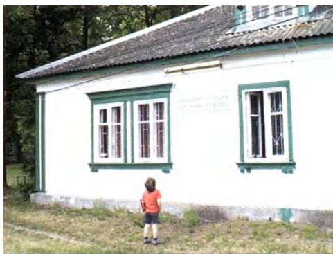
Mały czytelnik przed wejściem do Wypożyczalni nr 29 na Osiedlu Przyjaźń

cu w soboty o godz. 16.00. Jest to dogodny czas na rodzinne wyjście. Przedstawienia adresowane do dzieci młodszych mają zadanie edukacyjne, sprzyjające rozwojowi czytelnictwa. Biblioteka nawiązała współpracę z wieloma agencjami oferującymi ciekawe spektakle m.in.: Dur-Moll („Wesoły pociąg instrumentów”), „Na jesiennym liściu”, „W zaczarowanym lesie”), Teatrzyk „Jaś Parandyk” („Pchła Szachrajka”, „Żeby zmądrzały żaby”), Jurek Latos Teatr Dobrego Serca („Janosik i Dobry pasterz”, „Baśniowy Pokoik”). Na każdym spotkaniu frekwencja jest zadowalająca, można zobaczyć ogromną radość na twarzach dzieci. Potrzeba organizowania tego typu atrakcji w bibliotece nie wymaga dodatkowych uzasadnień.