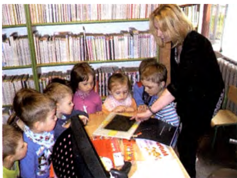
Wypożyczalnia nr 29

Nowatorską formą promowania czytelnictwa w naszej placówce jest „Noc w bibliotece”, która po raz pierwszy została zrealizowana w 2015 r. Cele takiej nocy to: promocja biblioteki, rozwijanie kultury czytelnicznej uczniów, poznawanie różnorodnej literatury dziecięcej, ożywanie zainteresowań czytelnicznych uczniów, kształtowanie wyobraźni twórczej ucznia, integracja grupy. Jest to prawdziwa rewolucja w bibliotece. Dotychczas można było spędzić noc w muzeum lub innych miejscach użyteczności publicznej. Sam fakt przebywania nocną porą w bibliotece oraz możliwość uczestnictwa w zabawach animacyjnych czy edukacyjnych sprawia dzieciom ogromną radość. Uczestnicy imprezy podzieleni są na trzy grupy wiekowe: młodsza 6-7 lat w godz. 17.30-19.30; starsza 8-10 lat w godz. 20.00-22.00; najstarsza 11-13 lat w godz. 18.00-22.00. W programie m.in.: „podchody” śladem książki, rebusy, krzyżówki, wspólne malowanie, czytanie... Na zakończenie dzieci otrzymują nagro-