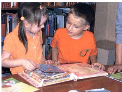
Czytelnia nr 17