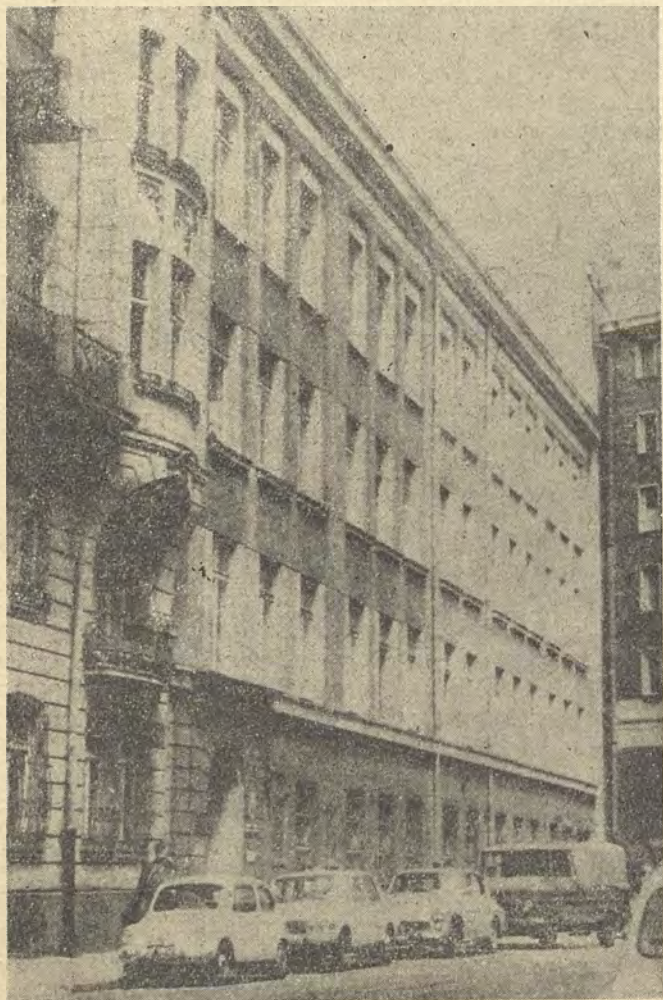
Siedziba Warszawskiej Drukarni Naukowej przy ul. Śniadeckich 8

— Zaczęła się ona w 1936 r. Rozpocząłem od praktyki, do wybuchu wojny w 1939 r. ukończyłem szkołę poligraficzną. Potem, wiadomo — wojna, okupacja, powstanie, pobyt w obozie jenieckim na terenie Nie-