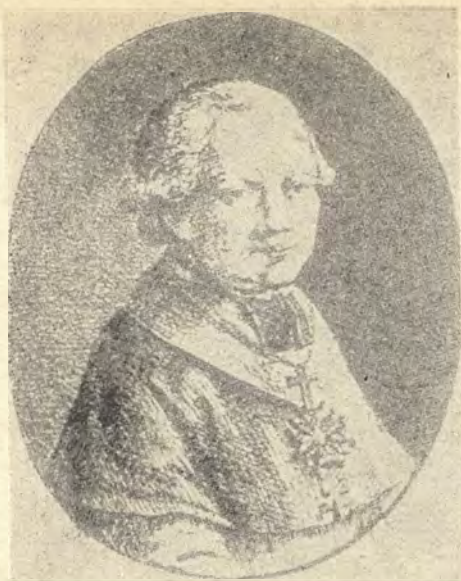
Ignacy Józef Massalski. 1729—1794. (Portret pędzla B. Dłuskiego)