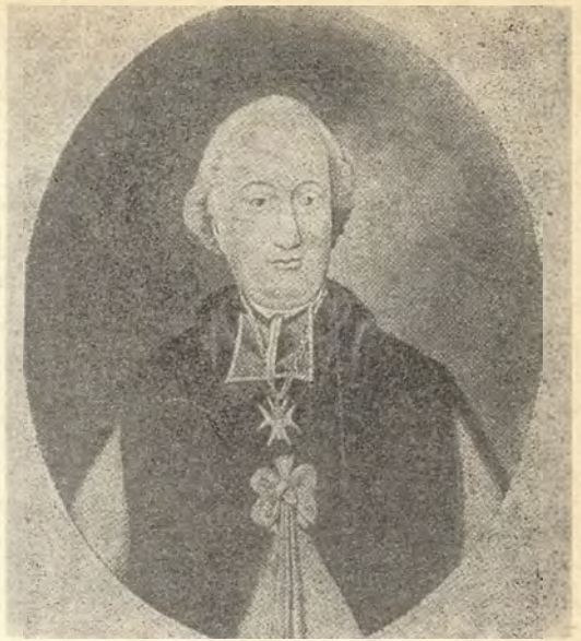
Grzegorz Piramowicz. 1735—1801.

Kopczyńskiego, arytmetyka, algebra i geometria L'Huilliera, historia Skrzetuskich, botanika i zoologia Kluka, nauka moralna Popławskiego.