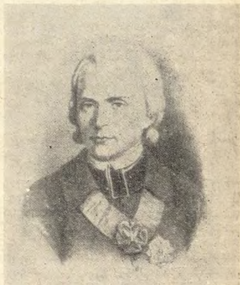
Marcin Poczubutt-Odlanicki. 1728—1810.