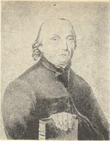
Onufry Kopczyński. 1735—1817. (Portret pędzla Majerskiego )