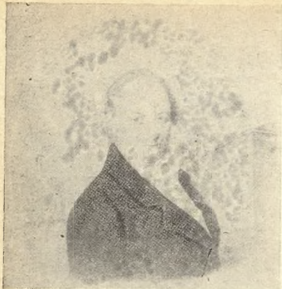
Jędrzej Śniadecki. 1768—1838.