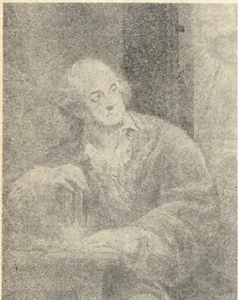
Stanisław August Poniatowski.

W niczym nie umniejszając znaczenia reformy Konarskiego, przełom w systemie oświaty był jednakże rezultatem zbiorowego wysiłku pierwszego pokolenia oświeconych, którzy uchwycili w swe ręce ster rządów w 1764 roku, w momencie elekcji Stanisława Augusta Poniatowskiego.