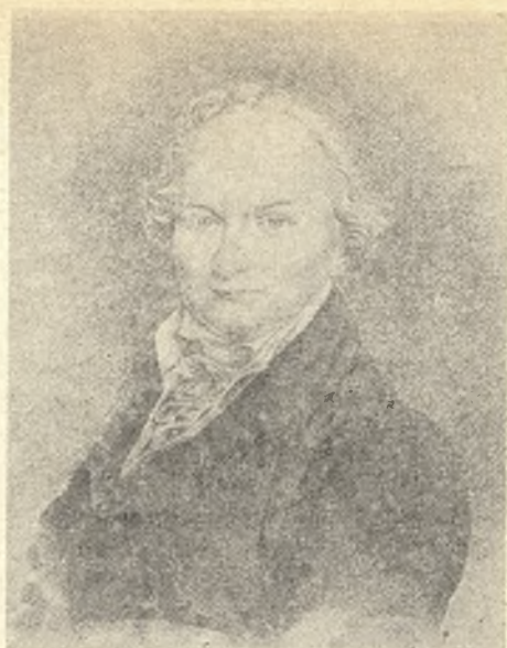
Jan Śniadecki. 1756—1830.

Struktura szkolnictwa w Polsce podporządkowywała dwom szkołom głównym, krakowskiej dla Korony i wileńskiej dla Litwy, szkoły wydzielone i podwydziałowe. Perspektywy zarysowane w pracach KEN były niezwykle ambitne. Komisja dyskutowała sprawę wychowania kobiet. Zrobiono tu pierwsze kroki, podobnie jak i w sprawie szkół parafialnych, których poziom był przedmiotem stałej troski członków Komisji. Opracowano program, przygotowano elementarz i objęto kontrolą blisko 800 szkół najniższego szczebla.