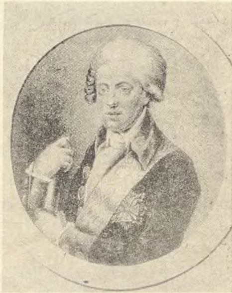
Ignacy Potocki. 1750—1809. (Portret pędzla W. Śliwickiego)