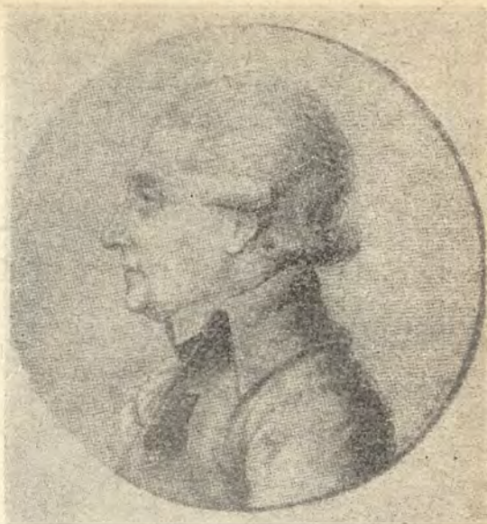
Michał Jerzy Poniatowski. 1736—1794. (Litografia H. Aschenbrennera)

„Zabawy Przyjemne i Pożyteczne”), propagowano literaturę dydaktyczną atakującą relikty struktur przestarzałych i proponującą nowe, oświeceniowe wzory życia społecznego. Jednakże w walce o nowe społeczeństwo rolę decydującą mogła odegrać jedynie szkoła. Ośrodek królewski