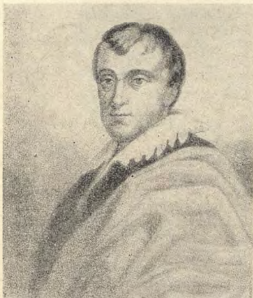
Andrzej Zamoyski. 1716—1792. (Staloryt)

„Zabawy Przyjemne i Pożyteczne”), propagowano literaturę dydaktyczną atakującą relikty struktur przestarzałych i proponującą nowe, oświeceniowe wzory życia społecznego. Jednakże w walce o nowe społeczeństwo rolę decydującą mogła odegrać jedynie szkoła. Ośrodek królewski