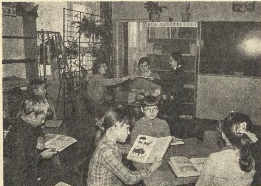
Biblioteka szkolna przy Szkole Podstawowej Nr 1 w Polkowicach. Klasa IIIc podczas zajęć w czytelni.

Na podstawie obserwacji można stwierdzić, że uczniowie kierują się głównie dwoma kryteriami w doborze książek — wypożyczają dalsze pozycje tego samego autora bądź książki odpowiadające kierunkowi własnych zainteresowań.