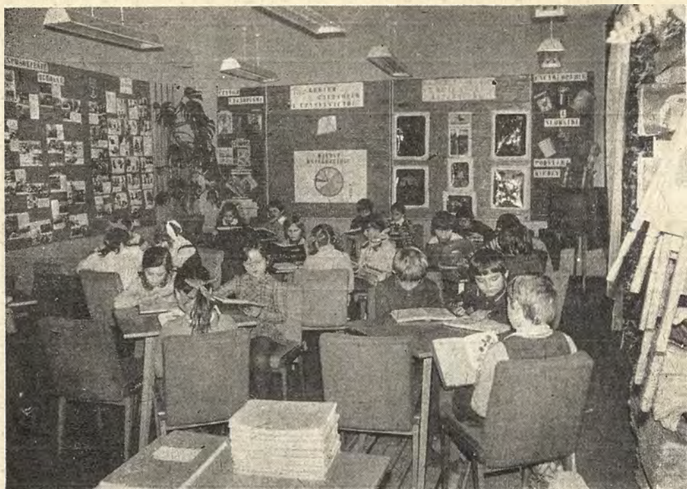
Biblioteka szkolna przy Szkole Podstawowej Nr 1 w Polkowicach. Czytelnia.

300 czytelników. Widzimy potrzebę stosowania różnych form pracy, podejmujemy je w zrozumieniu interesu społecznego. W naszym zawodzie nic się jednak nie zmienia, choć zmieniają się warunki życia. Stare przepisy sprzed lat nadal regulują sprawę etatów i sum rocznych na zakup książek, nie organizuje się kursów wakacyjnych dla bibliotekarzy i nie ma dla nich dodatków specjalnych. Jak powyższe sprawy będą wyglądały w szkole dziesięcioletniej?