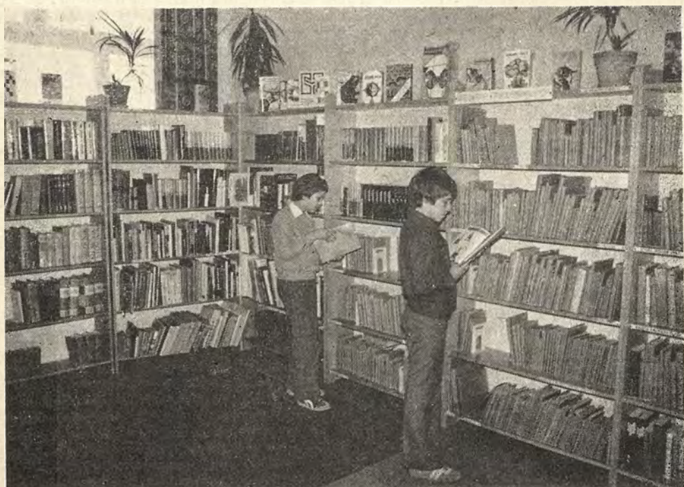
Biblioteka szkolna przy Szkole Podstawowej Nr 1 w Polkowicach. Wypożyczalnia.

Obszerny dział stanowiły druki, począwszy od wieku XV, zbiory kartograficzne, numizmatyczne (m.in. denar Mieszka I, grosze, talary, tyńf lwowski, złoty polski), sfragistyka (pieczęć koronna Zygmunta Starego, medale, plakiety) i wreszcie interesujące zbiory grafiki — miniatury portretowe, rysunki artystów polskich i obcych, ekslibrisy.