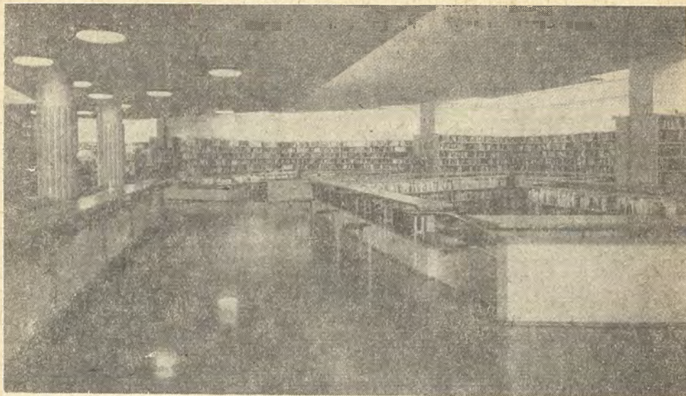
Wnętrze Miejskiej Biblioteki Publicznej w Rovaniemi

ków, przedstawiciele pokrewnych dziedzin nauki. Głównym zadaniem Rady jest ustalanie węzłowych kierunków rozwoju służby biblioteczno-informacyjnej oraz koordynacja działań w tym zakresie w skali ogólnokrajowej. TINFO należy do jednych z pierwszych na świecie instytucji zajmujących się kompleksowo problemami informacji. Podkreślić jednak trzeba, że z początku problemy bibliotek naukowych oraz zagadnienia informacji naukowej i technicznej rozpatrywane były oddzielnie, nie dostrzegano bowiem spójności problemów bibliotecznych z informacyjnymi. Tak więc prowadząca działalność w latach 1954—1972 Rada ds. Bibliotek Naukowych funkcjonowała w latach 1969—1972 równolegle z Fińską Radą ds. Informacji Naukowej i Technicznej. Postanowieniem Rady Ministrów w r. 1972 zintegrowano problemy bibliotek naukowych ze sprawami informacji naukowo-technicznej. Rok ten stanowi też ważną cezurę dla tworzenia w Finlandii centralnych bibliotek naukowych.