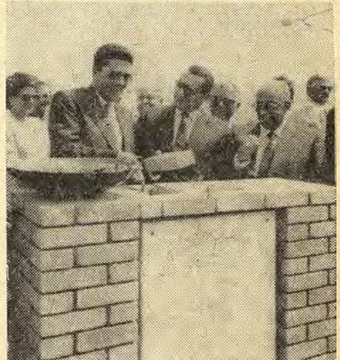
Położenie kamienia węǳielnego

Miasto przechodziło później z rąk do rąk, często płaǳowane i łupione. Było rządzone m.in. przez władczyńię Palmyry Zenobię, cesarzy rzymskich — Aureliana i Dioklecjana. W III i IV w. znaczenie miasta, nękanego konfliktami wewnętrznymi, stopniowo malało, aż w r. 641 Aleksandria została opanowana przez najeźǳców arabskich pod wodzą kalifa Omara. Biblioteka stała się wówczas już tylko szczątkiem tego, czym była za czasów swej świetności. Zwoje papirusów, niszczone przez czas, trudniej było utrzy-