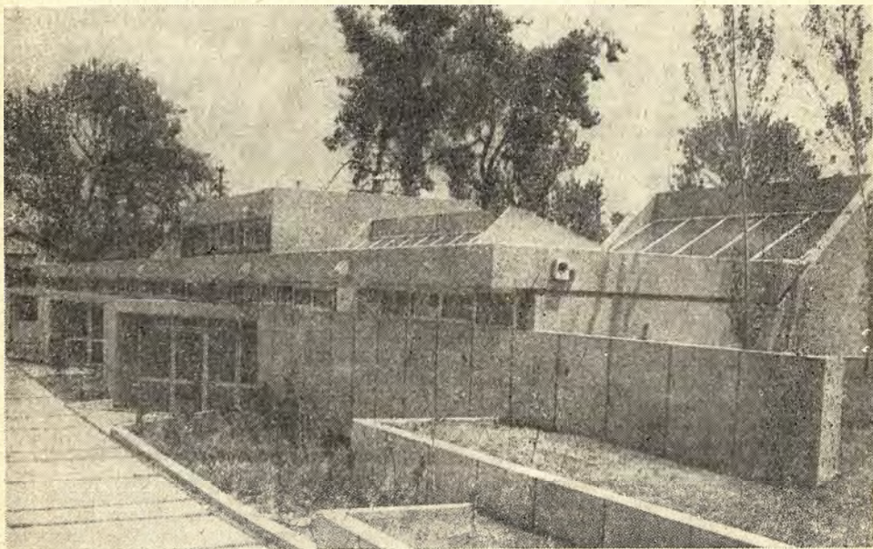
Miejska Biblioteka Publiczna Papastratos w Agrinio

Lista większych bibliotek publicznych działających w Grecji nie jest długa, obejmuje biblioteki w następujących miastach: w Agrinio (Biblioteka Papastratos); na Krecie: w Chania (Biblioteka Malm-