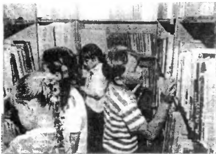
Fot. biblioteki — obraz z inicjatywy pani Gzdecko

Jubileusz 90-lecia istnienia obchodziła w maju br. Wojewódzka Biblioteka Publiczna w Skierniewicach. Z powstałej w 1906 r. małej „Czytelni Ludowej” przekształciła się na przestrzeni lat w dysponującą ponad 200 tysiącami woluminów, w dużym stopniu skomputeryzowaną księżnicę. Od r. 1986 Bibliotece patronuje blisko związany z ziemią skierniewicką pisarz noblista Władysław Stanisław Reymont.