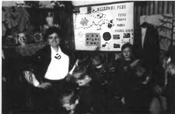
Lekcja biblioteczna pt. „Wędrowki Pyzy, czyli piękna nasza Polska cała” w MBP – Filia nr 2 w Ozorkowie