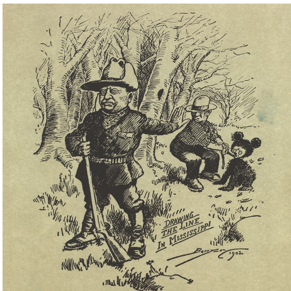
Drawing the Line in Mississippi - Clifford Berryman