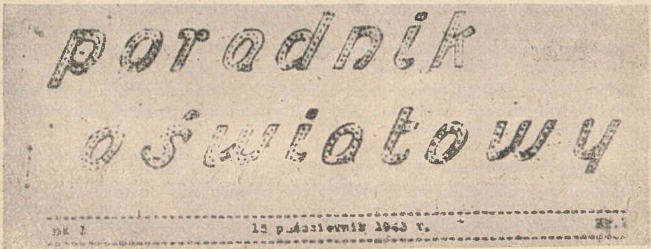
Nagłówki czasopism wydawanych w okresie okupacji