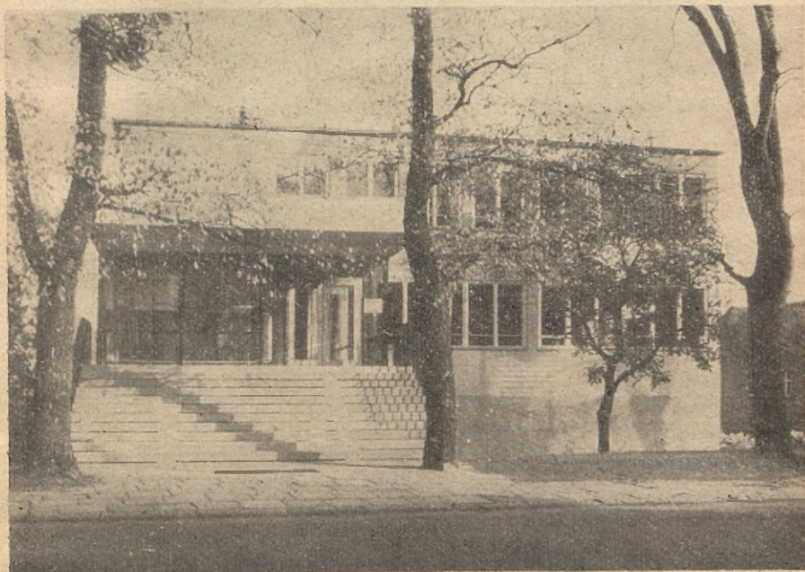
Biblioteka Wyższej Szkoły Ekonomicznej w Sopocie, dr arch. Jerzy Wierzbicki. Widok wejściowy od strony ulicy.

Biblioteka posiada 171 miejsc w czytelniach oraz pojemność magazynów na 200 000 tomów. Od strony wejściowej widoczne są tylko 2 kondygnacje: wysoki parter, który mieści dział udostępniania, oraz I p. z czytelniami: naukową i bibliograficzną, działem opracowania zbiorów i pracowniami specjalnymi. Magazyny książek zajmują dwie najniższe kondygnacje, które dzięki stromej skarpie znajdują się ponad terenem.