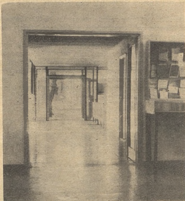
Oś wejściowa. Z prawej strony na pierwszym planie widoczna gablota wystawowa. Dalej w głębi — lada w szatni. Poprzez kolejne drzwi oszklone widoczne zarysy drzew i otaczającej zieleni.

osobowy 180 x 60 cm. Wymienna półka regału książkowego nie powinna przekraczać długości 90 cm. Jest to jeszcze obciążenie, które magazynier przenosi bez nadmiernego wysiłku.