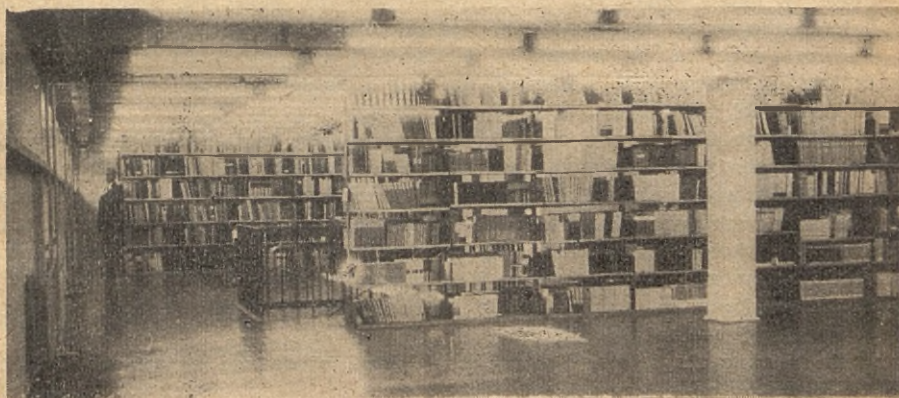
Magazyn książek. Na pierwszym planie pole jeszcze niezagospodarowane. Za pierwszym regalem widoczna balustrada kłateczki schodowej prowadzącej do następnej niższej kondygnacji magazynu.

Projektowane meble musiały odpowiadać następującym warunkom: stabilność, jednorodność konstrukcyjnego rozwiązania, wzajemna wymiennność poszczególnych typów, kompozycyjna lekkość. Aby spełnić te wszystkie warunki, zastosowano wszędzie podstawy ze stali profilowanej kątovej. Nogi z dwóch kątowników 30 x 30 x 4 mają przekrój prostokątny bardzo zbliżony do kwadratu. Ramy poziome z kątownika 35 x 35 x 4. Na tych podstawach przy pomocy wkrętów mocowane są blaty stołów, pudła regałów i pojemników kart katalogowych, pudła lad, komód i gablot. Pudła te wykonane są z płyt stolarskich fornirowanych jasnym jesionem polskim.