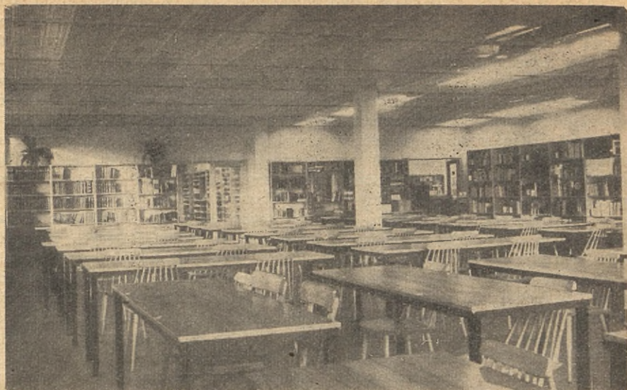
Czytelnia ogólna, zdjęcie dzienne. Z lewej strony w głębi poprzez oszklone drzwi widoczne regały w czytelni czasopism. Z prawej strony w głębi poprzez oszklone drzwi. Widoczna pionowa gabłota wystawowa stojąca pod ścianą w hall'u — katalogu — wypożyczalni. Na pierwszym planie dwuosobowe stoły dla czytelników i lekkie, ale bardzo wygodne i stabilne krzesła.

Projektowane meble musiały odpowiadać następującym warunkom: stabilność, jednorodność konstrukcyjnego rozwiązania, wzajemna wymiennność poszczególnych typów, kompozycyjna lekkość. Aby spełnić te wszystkie warunki, zastosowano wszędzie podstawy ze stali profilowanej kątovej. Nogi z dwóch kątowników 30 x 30 x 4 mają przekrój prostokątny bardzo zbliżony do kwadratu. Ramy poziome z kątownika 35 x 35 x 4. Na tych podstawach przy pomocy wkrętów mocowane są blaty stołów, pudła regałów i pojemników kart katalogowych, pudła lad, komód i gablot. Pudła te wykonane są z płyt stolarskich fornirowanych jasnym jesionem polskim.