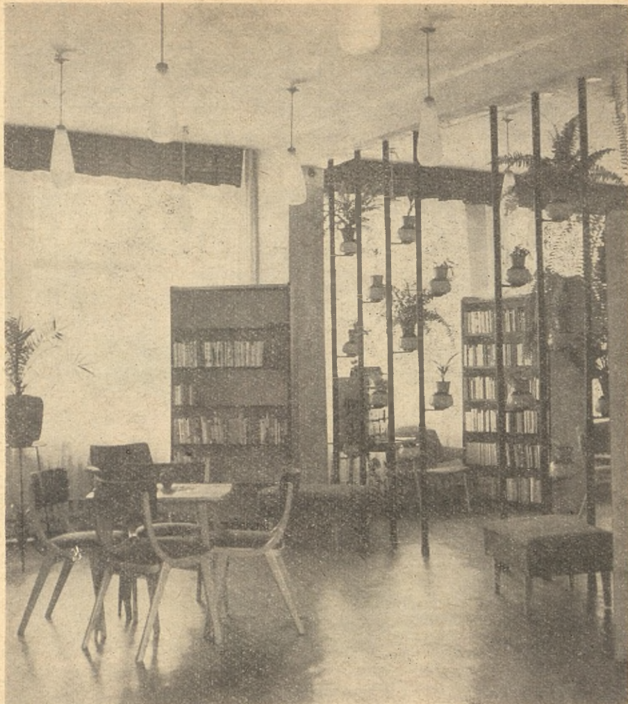
8 BR dla Dorosłych, ul. Cieszkowskiego 11