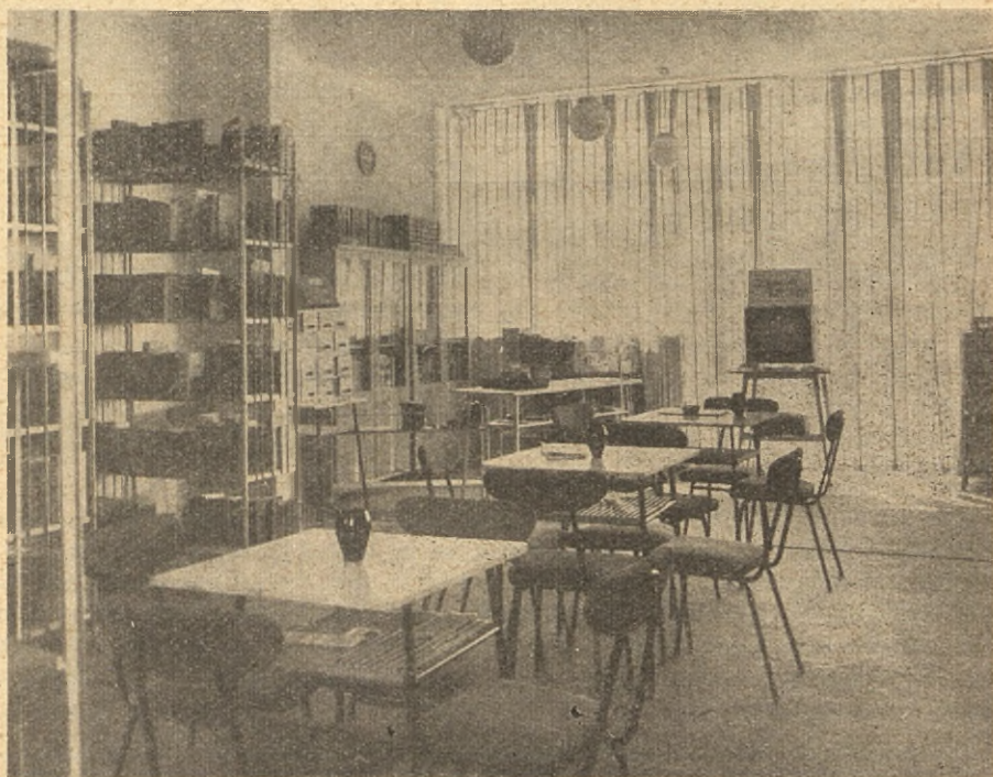
Fragment Publ. Bibl. Dzieln. Łódź-Polesie.

Z przedstawionej tu tabeli wynika, iż w 1975 roku Łódź będzie posiadała 110 bibliotek. Ponad połowa z nich umieszczona zostanie w lokalach pochodzących