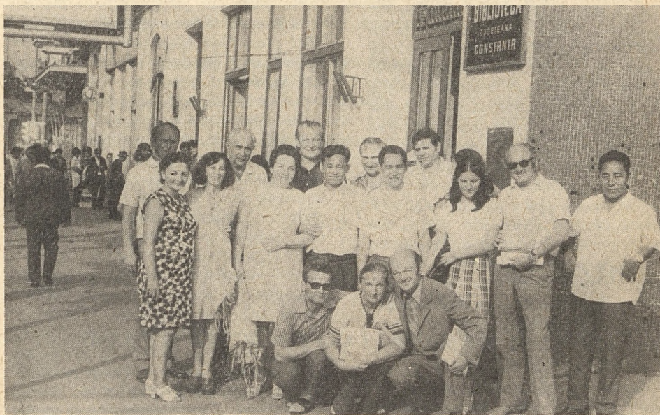
Uczestnicy VII Narady Ośrodków Bibliotecznych i Metodycznych Krajów Socjalistycznych.

opracowywaniem mają na względzie nie tylko efekty ekonomiczne, ale również merytoryczne. W większych placówkach nie tylko łatwiej o wyposażenie techniczne, środki finansowe, ale i o kwalifikowanych bibliotekarzy, co wpływa na wyższą jakość usług bibliotecznych. Odciążenie małych bibliotek od obowiązków katalogowania, klasyfikowania i całego zespołu czynności towarzyszących przysposobieniu książki umożliwia im skupienie prac wokół udostępniania materiałów bibliotecznych