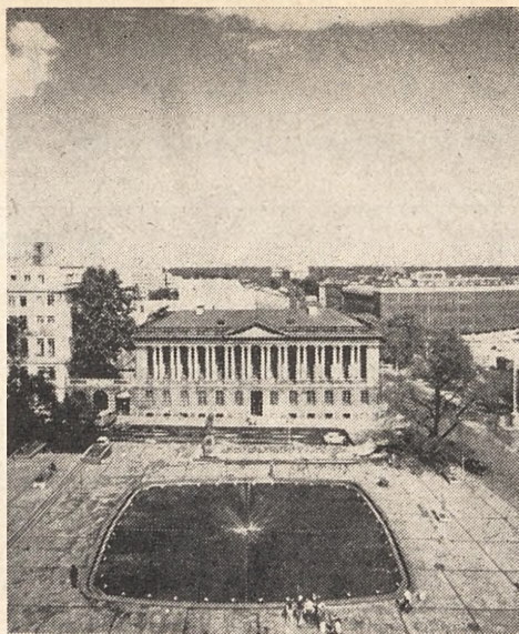
Biblioteka Raczyńskich — widok ogólny — 1978 r.

Podstawowy dokument, statut fundacyjny, podpisany 29.II.1829 r. został zatwierdzony w styczniu 1830 r., przez króla pruskiego, który zwolnił Bibliotekę od opłat stemplowych i podatków przyznając równocześnie prawo do egzemplarza obowiązkowego z terenu Wielkiego Księstwa Poznańskiego.