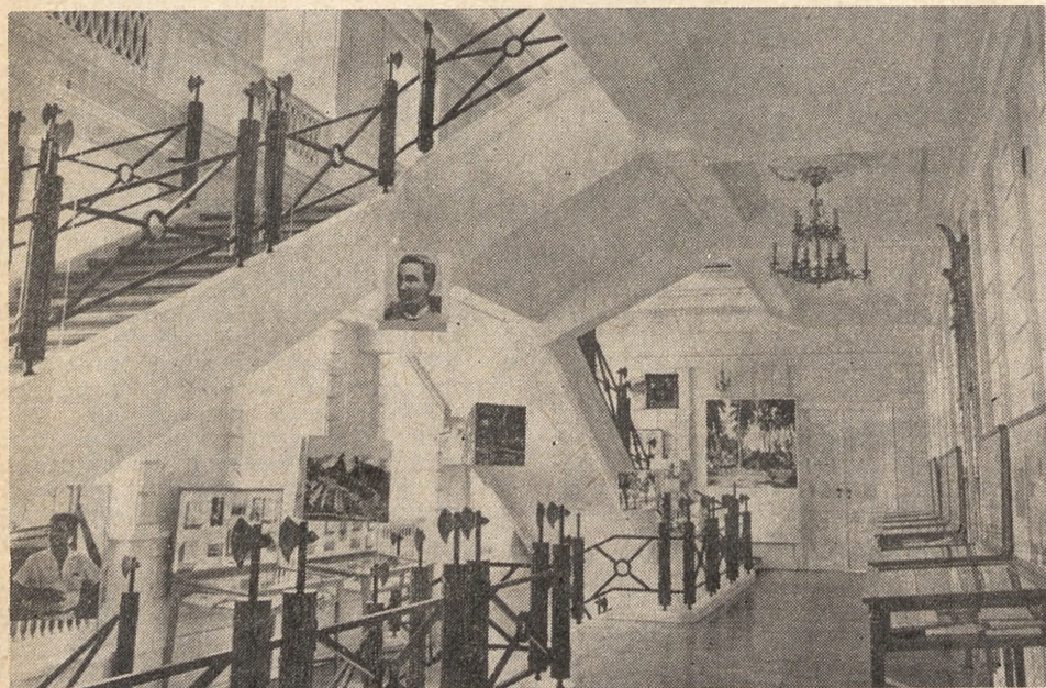
Biblioteka Raczyńskich — fragment wystawy „Polacy na szlakach świata”.