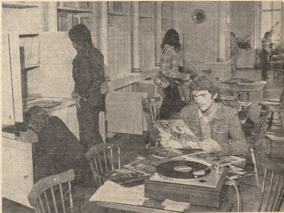
Filia 39 — wypożyczalnia płyt.