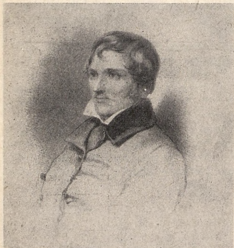
Edward Raczyński 1786—1845 — litografia Maksymiliana Fajansa.

Oddanie do użytku Biblioteki minęło dosyć niepostrzeżenie, mimo że poprzedziły je długotrwałe, od 1816 r. trwające starania i negocjacje z władzami o kupno parceli i termin realizacji budowy. Wznosząc okazały jak na owe czasy gmach, wzorowany na wschodniej fasadzie Luwru, Raczyński ukrywał bardzo długo zamiar umieszczenia w nim biblioteki publicznej. Prawdopodobnie nie miał zaufania do władz pruskich i wolał działać przez zaskoczenie przy zachowaniu wszystkich pozorów lojalności i praworządności. Dlatego starał się zapewnić fundacji odpowiednie akty prawne, które gwarantowałyby, że jej działalność będzie zgodna z intencjami założyciela i rzeczywistymi interesami polskiego społeczeństwa.