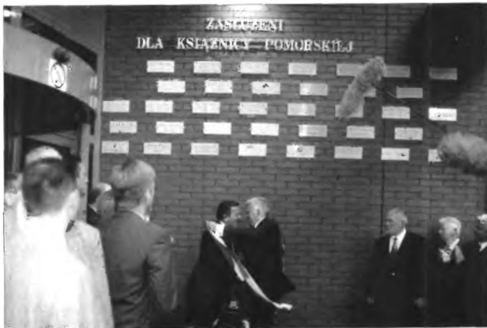
Premier J. Buzek i kanclerz G. Schroeder po odświeżeniu tabliczek pamiątkowych

lub miejską bibliotekę, a prasa donosi o wizytach w bibliotekach wybitnych osobistości i to nie tylko literatów czy naukowców, co jest jakby sprawą naturalną i praktykowaną od dawna, ale także wybitnych polityków i wysokich urzędników państwowych. Mam tu na myśli np. wystąpienie prezydenta USA George'a W. Busha w Bibliotece Uniwersytetu Warszawskiego w obecności m.in. prezydenta RP Aleksandra Kwaśniewskiego (15.06.2001), czy ostatnio (14.08.2001) pobyt premiera RP Jerzego Buzka i kanclerza RFN Gerharda Schroedera w Książnicy Pomorskiej w Szczecinie.