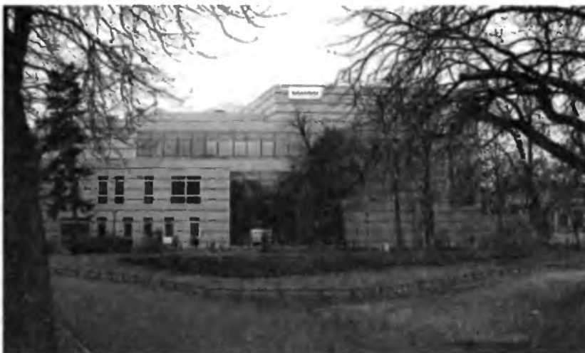
Widok nowego budynku WiMBP od strony parku Wiosny Ludów

by zaczęto mówić coraz głośniej. Dzięki wsparciu finansowemu Urzędu Marszałkowskiego, Ministerstwa Kultury i Dziedzictwa Narodowego i programowi unijnemu w ramach Zintegrowanego Programu Operacyjnego Rozwoju Regionalnego udało się zrealizować to szczytne zadanie.