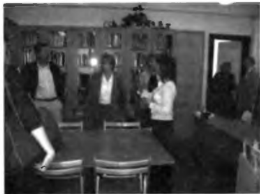
Uczestnicy konferencji prasowej zwiedzają pomieszczenia biblioteki Zespołu Szkół Nr 2 im. W. Rutkiewicz w Warszawie – gospodarza konferencji

Jak co roku, tak i tym razem ZG SBP zorganizował w pierwszym dniu TB (5 maja) konferencję pra-