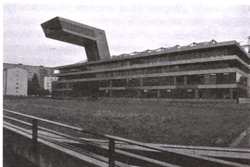
Budynek Biblioteki Miejskiej w Salzburgu

W dniu 21 czerwca 2002 r. w Wiedniu Zgromadzenie Ogólne Austriackiego Związku Bibliotek i Usług jednogłośnie przyjęło program rozwoju bibliotek. Jego realizacja sprawia, że biblioteki stają się nowoczesnymi miejscami nie tylko udostępniającymi najnowsze książki i opracowania, ale również pełniącymi rolę społecznych, nowoczesnych centrów kultury.