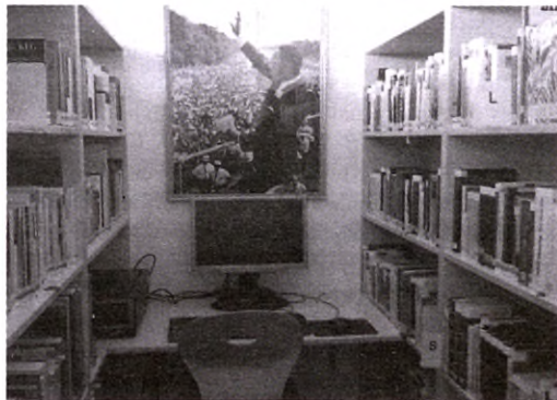
Biblioteka szkolna w gimnazjum w Bad Reichenhall

Austria należy do tych krajów europejskich, które nie posiadają ustawy bibliotecznej. Oznacza to, że nie ma podstaw prawnych do powoływania i utrzymywa-