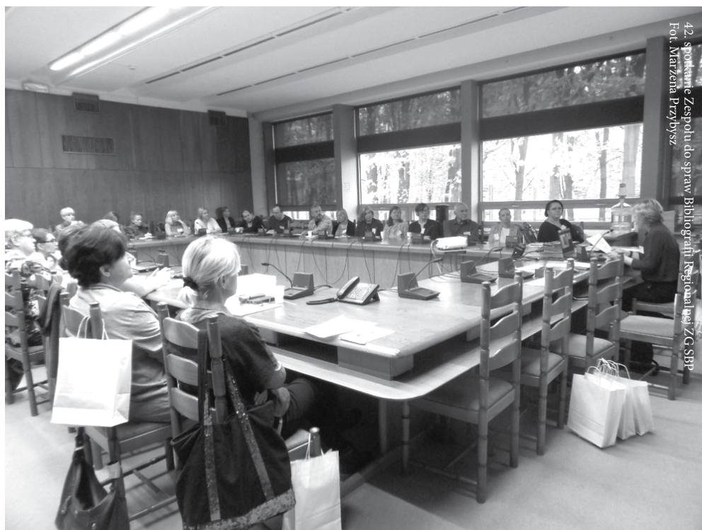
42. spotkanie Zespołu do spraw Bibliografii Regionalnej ZG SBP