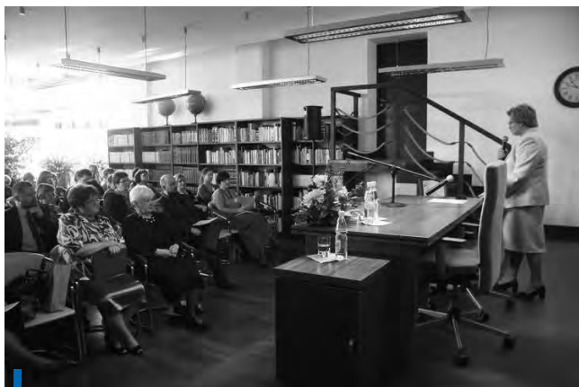
Ogólnopolska Konferencja „Bibliografia regionalna w komunikacji publicznej”, 2012 r.