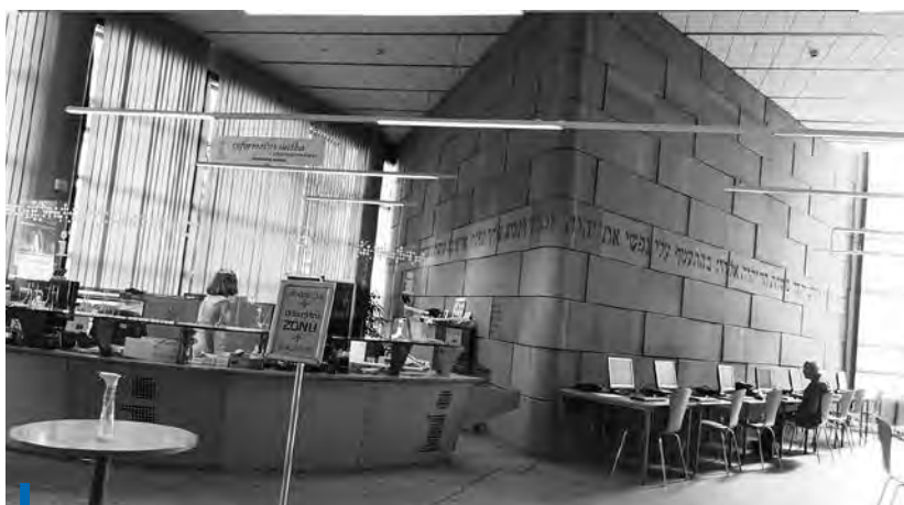
Stanowisko informacji z widoczną ścianą synagogi wcinającą się do wnętrza biblioteki

lat później nastąpiło połączenie biblioteki publicznej z naukową, a w 1990 r. księżnica otrzymała miano Państwowej Biblioteki Naukowej. Wobec coraz wyraźniej rysującego się problemu braku miejsca na zbiory w bibliotece, koniecznością było wybudowanie lub pozyskanie kolejnej jej siedziby. W 1997 r. rozpoczęto budowę nowego gmachu. Nowego i bardzo symbolicznego w swej wymowie. Bowiem obecny budynek Biblioteki Wojewódzkiej w Libercu stanowi bardzo ciekawy przykład architektury łączącej funkcjonalność z przemyślanym programem ideowym, a także z symbolicznym przesłaniem. W Libercu, w miejscu, gdzie obecnie znajduje się Wojewódzka Biblioteka Naukowa, do