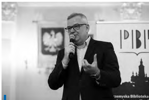
Artur Andrus

który oczarował publiczność inteligentnym humorem i opowieścią o butach Marii Czubaszek odebranych od optyka.