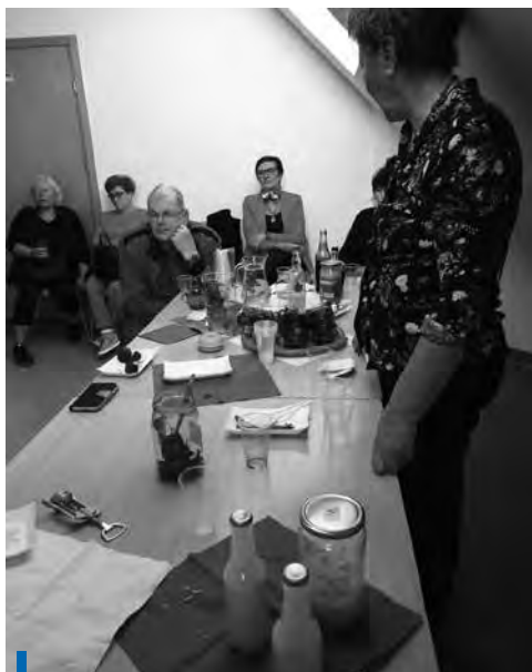
Spotkanie klubu DKK „Laboranci z Karkonoszy”

Sukcesem zakończyły się również obchody „Światowego Dnia Książki”, które w 2018 r. odbyły się pod hasłem „Tradycje ziołolecznictwa w Karkonoszach”. Impreza zgromadziła licznych uczestników, a także otrzymała patronat Europejskiego Roku Dziedzictwa Kulturowego.