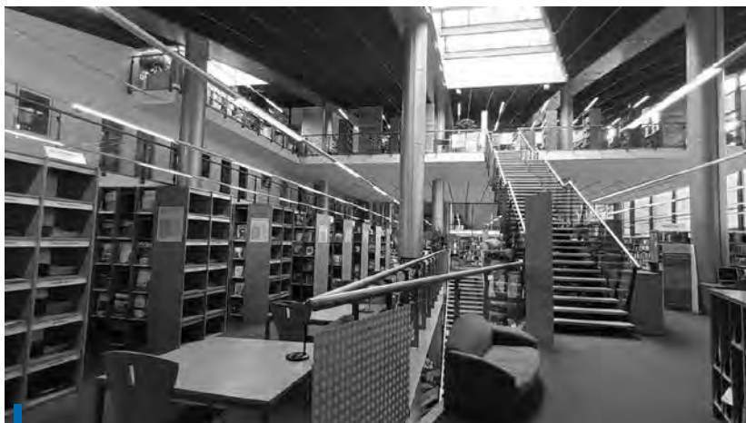
Wnętrze biblioteki, wolny dostęp

Narodowe uchwaliło ustawę o bibliotekach, która zobowiązywała gminy do zakładania gminnych bibliotek i czytelni. Ustawa wymagała również, aby w gminach z mniejszością narodową powstawały biblioteki dla członków tej grupy społecznej. Narastające niepokoje drugiej połowy lat trzydziestych XX w. spowodowały zamknięcie czeskiej biblioteki publicznej w 1938 r., którą ponownie uruchomiono po wojnie w 1945 r. Należy wspomnieć także, że w Libercu działały dwie inne biblioteki specjalistyczne – księżnice Muzeum Północnoczeskiego oraz Izby Handlowej.