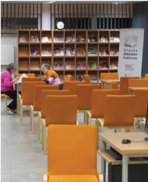
➔ Fot. w artykule z archiwum biblioteki

ka Publiczna, Powiatowa i Miejska Biblioteka Publiczna, Miejska Biblioteka Publiczna, Miejsko-Gminna Biblioteka Publiczna). Biblioteka używa odrębnego budynku. W 1968 r. rozpoczęto budowę obecnej siedziby biblioteki. Duży funkcjonalny budynek oddano do użytku w maju 1971 r. Mieści się w nim Wypożyczalnia Główna i Filia dla Dzieci. Od 2016 r. biblioteka jest właścicielem użytkowanej nieruchomości. Biblioteka Publiczna w ogólnopolskim Rankingu Bibliotek w 2017 r. znalazła się na 2. miejscu