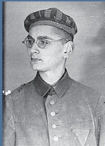
Władysław Bartoszewski podczas pobytu w obozie koncentracyjnym