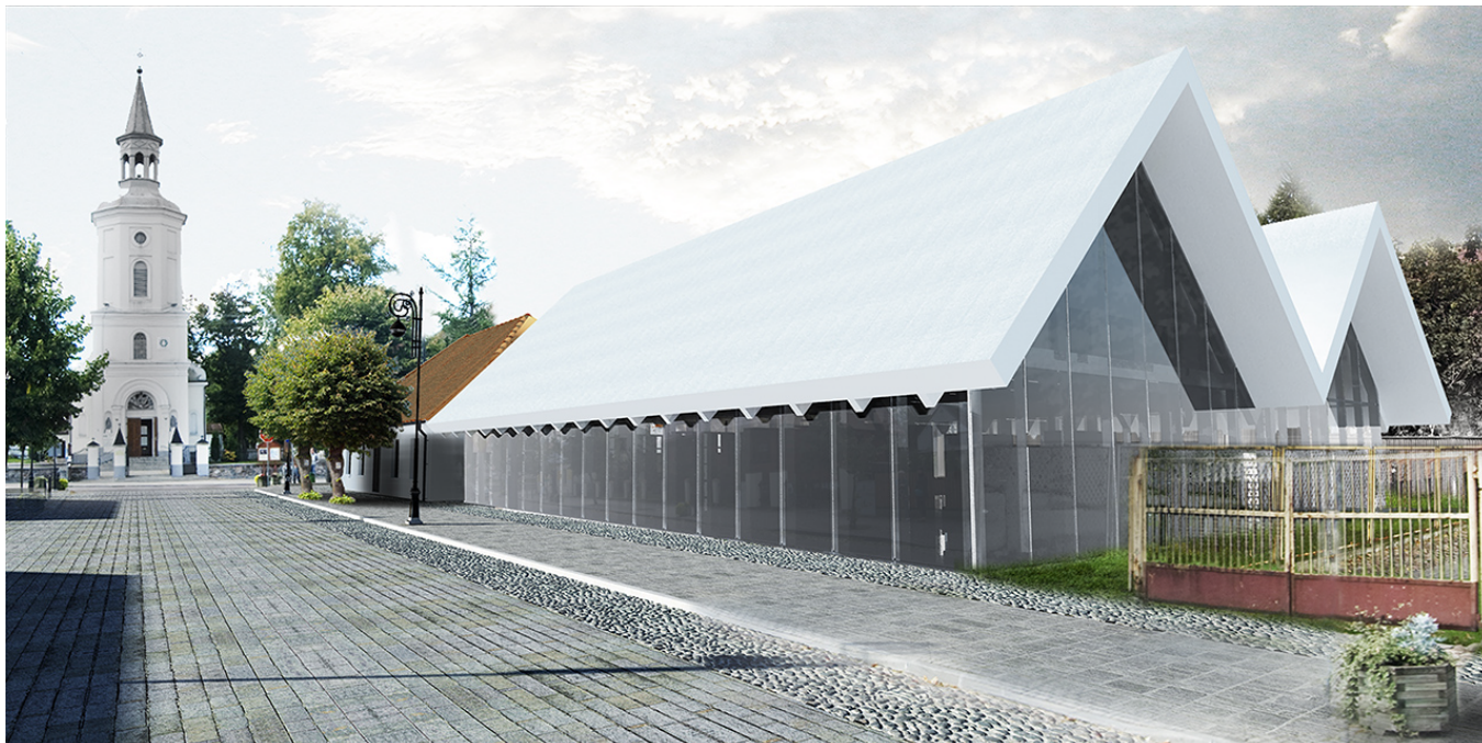
I nagroda, biuro projektowe ŻUKOWSKI – MACIEJ ŻUKOWSKI z Białegostoku, projekt biblioteki w Supraślu